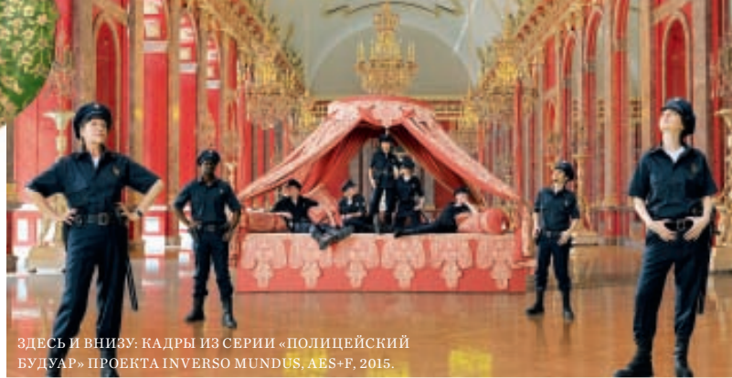
ЗДЕСЬ И ВНИЗУ: КАДРЫ ИЗ СЕРИИ «ПОЛИЦЕЙСКИЙ БУДУАР» ПРОЕКТА INVERSO MUNDUS , AES+F, 2015.